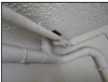
Photo N° 566 ECH-N°2 CALORIFUGEAGE PARKING Conduits de fluide Laine minérale + enveloppe bituminée

Dossier n°: 2013-09-300 FK DTA PC 083LAG OPH